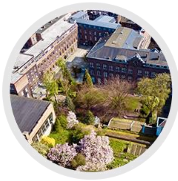
HELMo Campus des Coteaux