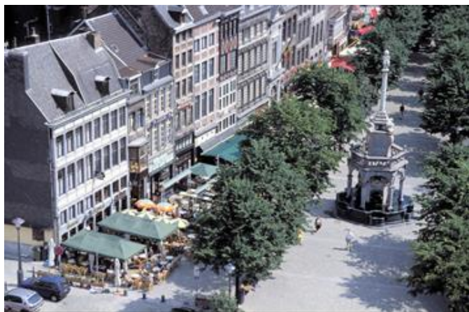
Le Perron, place du Marché

Bruxelles bilingue Communauté Française Communauté Flamande Communauté Germanophone